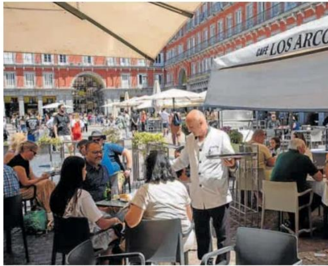
Una terraza llena en el centro de Madrid. ANTONIO LÓPEZ

Es evidente que, en parte, los elevados precios del sector están detrás de esos mayores niveles de gasto. Pero también que hay una parte del consumo que ha resistido contra viento y marea el arreo de la inflación: el ocio diurno en el que el aperitivo y el tardeo se han convertido en los auténticos salvadores para el sector. «En un contexto inflacionis-