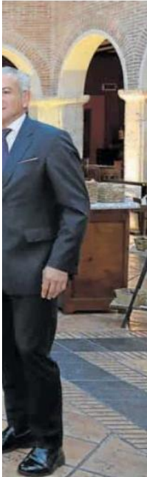
Cuerpo, Iñaki Arechabaleta (El

El ministro no eludió ninguna de las preguntas planteadas por el numeroso público presente en la conferencia