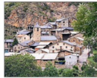
Besardán, en el Alt Urgell. E.M.

Sus actuales 20.000 habitantes de carácter permanente suponen un crecimiento del 7% desde 2020 y del 4% desde principios de siglo. Pero, excepto en la capital, Puigcerdà, en casi todos los municipios el número de segundas re-