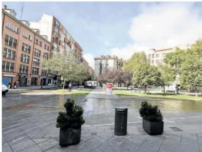
La céntrica plaza de San Miguel.

plátanos de sombra, si bien sería muy importante realizar un estudio del jardín en el que se ubica la estatua de Felipe II» para intentar mejorar su integración. Subrayan que es «muy importante reubicar el mobiliario existente y tratar de encontrar otro más acorde en su diseño al destacado espacio público en armonía a su vez con todo el centro histórico», además de reforzar su iluminación ornamental dentro de la ruta Ríos de Luz.