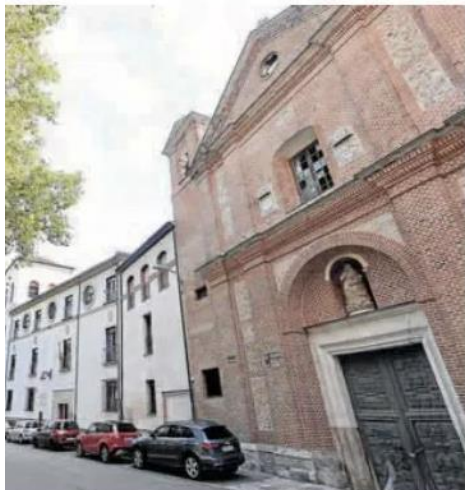
Santa Brígida y del Palacio del Licenciado Butrón, en la plaza de las Brígidias.