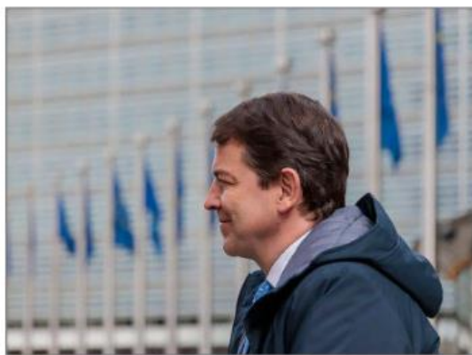
Alfonso Fernández Mañueco, en una imagen de archivo.

El martes 22, el jefe del Gobierno autonómico aprovechará su presencia en la capital francesa para materializar una reunión pendiente con la Dirección de Renault en París, en la sede que la compañía tiene en la capital francesa.