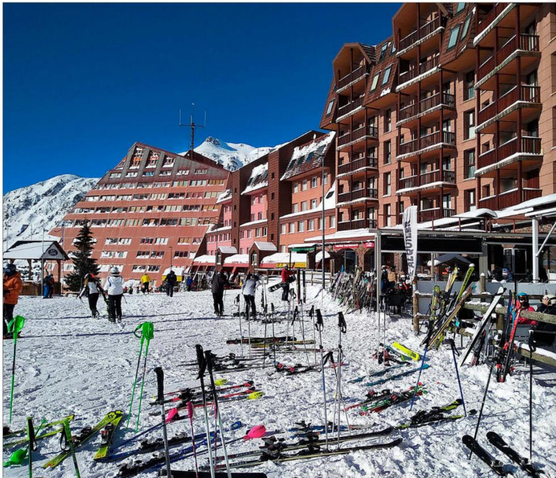
Alojamientos y establecimientos de restauración junto a la estación de esquí de Astún, en Aragón, en diciembre de 2020.