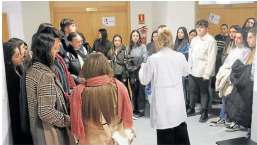
Jornada de puertas abiertas en la Facultad de Medicina de la Universidad de Valladolid, el pasado mes de febrero.