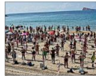
Playa de Benidorm.