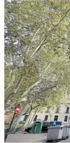
Fachadas de la iglesia del convento de