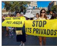
Manifestación en Palma.

El problema no sólo afecta a los empleados turísticos. También a funcionarios públicos, clave para reforzar los servicios públicos, especialmente en temporada turística, cuando se colapsan y faltan