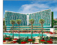
Club Med en Marbella. E.M.

CHEMA RODRÍGUEZ SEVILLA Epicentro tradicional del turismo en Andalucía, los municipios de la Costa del Sol han visto en los últimos años cómo los precios de las viviendas se han disparado al tiempo que la oferta se desplomaba. Ya hay hoteles que se han visto forzados a buscar y proporcionar alo-