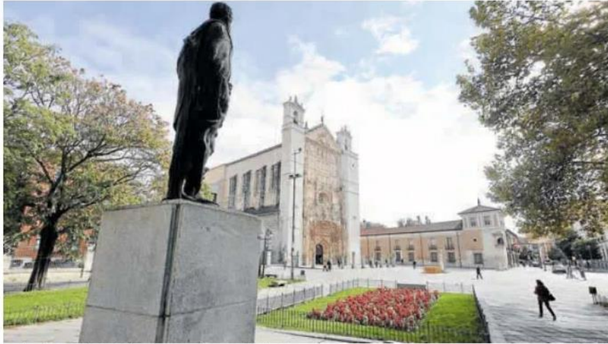
La plaza de San Pablo desde el lugar que ocupa la estatua de Felipe II.