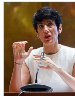
La ministra Eima Satz.

La otra décima responde a que Bruselas no ha tenido en cuenta la última actualización de las proyec-