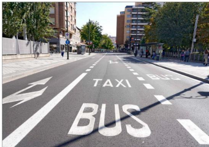
Una imagen de archivo de las inmediaciones de la plaza Pontente, donde se aplicará la ZBE. ICAI.

El concejal de Medio Ambiente y Sostenibilidad indica que los sensores que medirán la contamina-