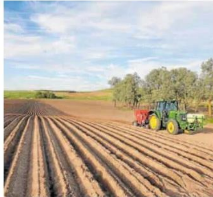
Labores de siembra en una parcela de la región. J. ARROYO

A esta novedad jurídica suma la PAC otras cinco para la campaña 2024-2025, entre ellas la ampliación de quién puede solicitar derechos de la reserva nacional. Para optar a los mismos, es preciso estar dado de alta en el régimen de la Seguridad Social como trabajador por cuenta propia o autónomo por el ejercicio de la actividad agraria que determine su incorporación. «Ahora