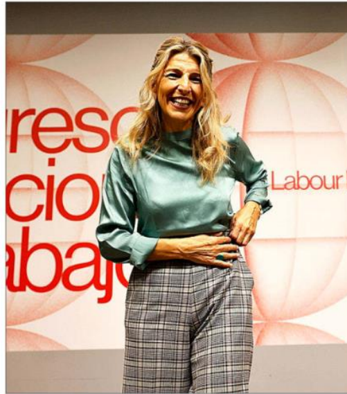
La vicepresidenta segunda del Gobierno, Yolanda Díaz. ANTONIO HEREDIA

De hecho, en el bautizado como Plan Pyme 375 , el Ministerio de Tra-