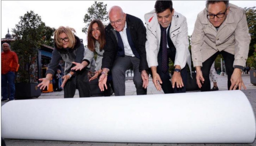
Momento en el que se extiende la nueva alfombra azul de la Seminci. E. M.