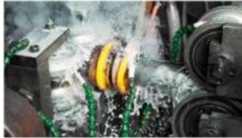
Forming & Protection