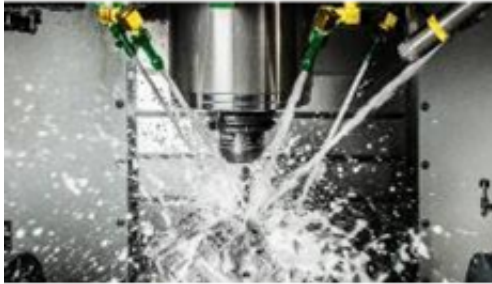
Metalworking & Cleaning